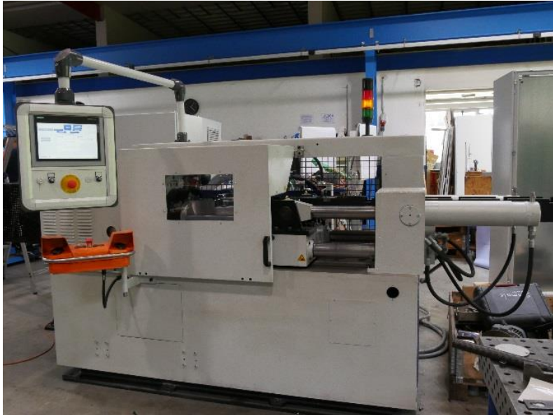
Nach der Generalüberholung. Sicherheit und Technik des 21. Jahrhunderts