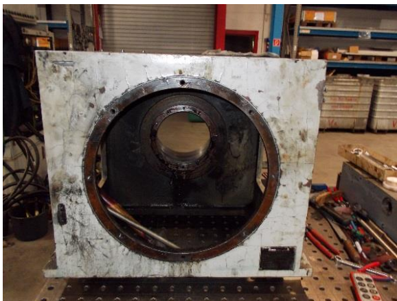
Zerlegung der Maschine

Schmale Maschinenbau GmbH Altenaer Str. 95 D-58762 Altena www.schmale-gmbh.de